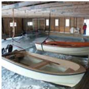
12. Vintern kommer och båtarna hissas upp över istäcket. En regel ser till att båtarna inte deformeras av tyngden från sin egen vikt.