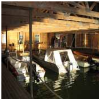
11. Stora utrymmen i båthuset gör det lätt att lägga till och komma ut med båtarna, som i aktern är förtöjda i vajrar, fastgjorda i takstolarna.