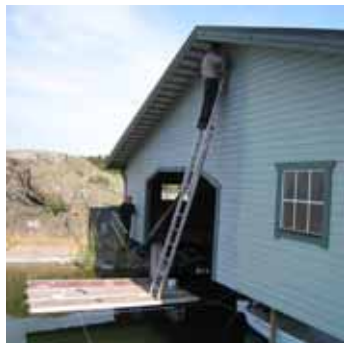
10. Dags att måla om båthuset sommaren 2008. Vajer spänns från klippsida till klippsida och på vajrarna läggs skivmaterial så att man resa stegarna mot gaveln.