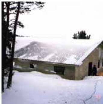
9. Vintern har slagit till hårt och hela båthuset är nu panelat.